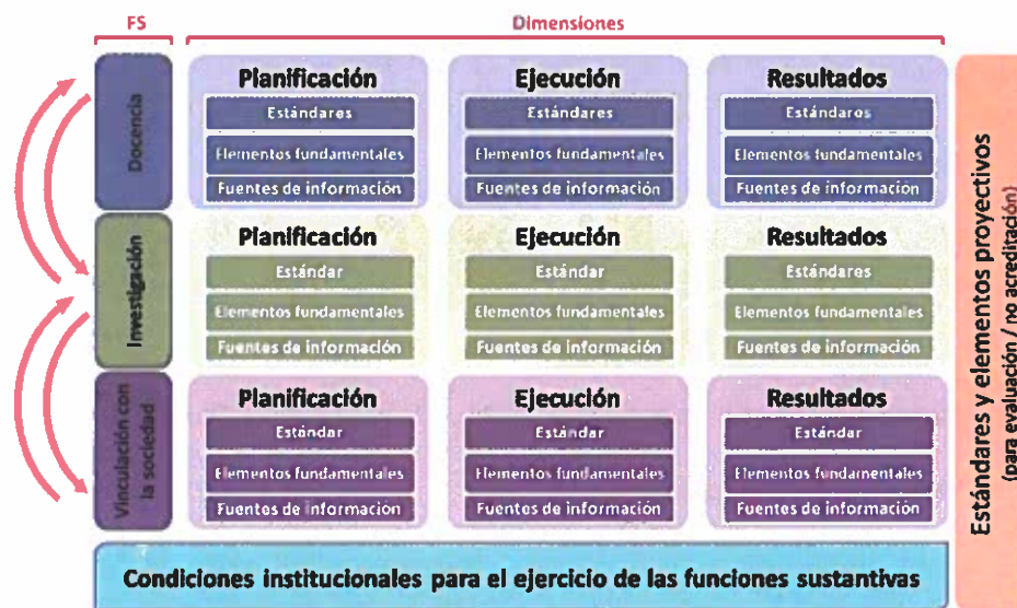
Gráfico 1: Esquema de la estructura del modelo 2019

Este esfuerzo del conjunto del SES, que refleja un paso significativo de mejoramiento general, será aprovechado en la próxima evaluación, no solo para la definición de los rangos de desempeño en los estándares cuantitativos sobre bases reales de la historia reciente, sino también para ahorrar a las IES, una parte de la carga operativa de entrega de información para la evaluación.